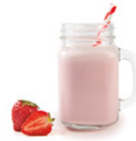
52P459NA10 | Bebida Cremosa Fresa