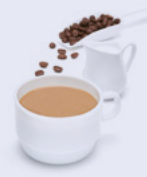
52R187NB10 | Bebida sabor Café Latte