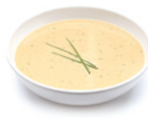
52P002NA10 | Crema de Pollo