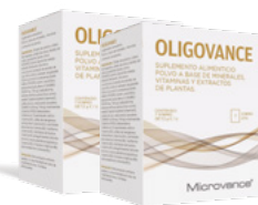
+ 2 Cajas de Oligovance

La composición de los Packs Protéifine puede ser modificada en cualquier momento por Laboratorios Ysonut de acuerdo con la disponibilidad de los productos.