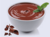
52R068NB10 | Postre sabor Chocolate