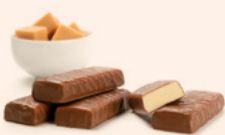
52R456NA10 | Barrita sabor Toffee - Chocolate con Leche