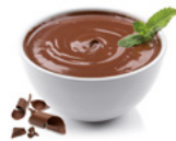
52R068NB10 | Sérovance Postre sabor Chocolate