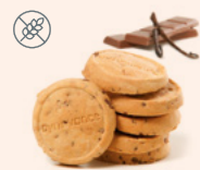
52R461NA10 | Galletas con chispas sabor Chocolate