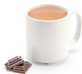
52P012NA10 | Bebida de Cacao