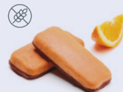
52R463NA10 | Panque sabor a Naranja con Cobertura sabor a Chocolate